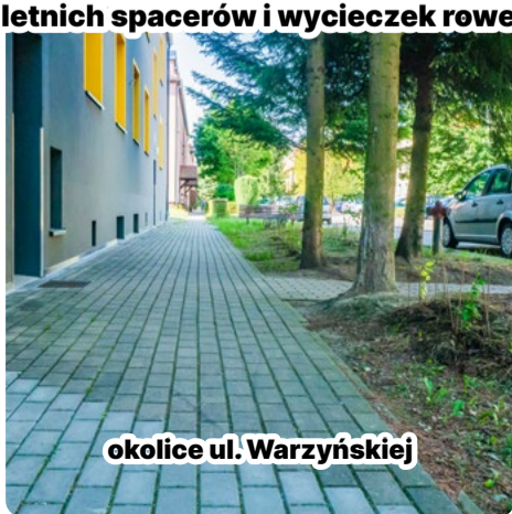
okolice ul. Warzyńskiej