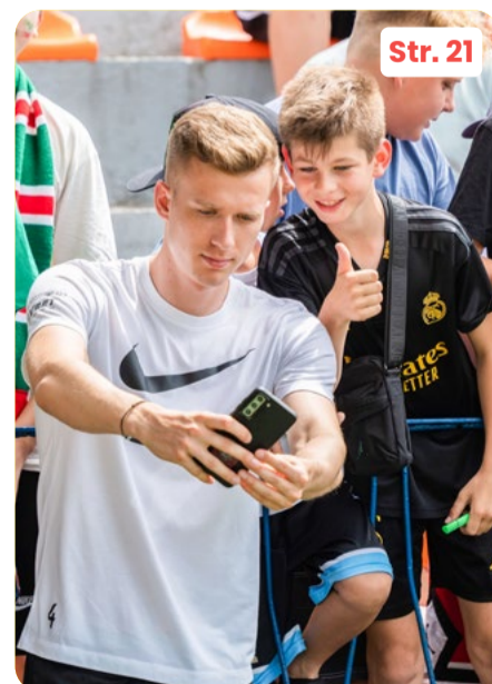
Tak dolnobrzeżanie kibicowali reprezentacji Polski w meczach Euro 2024