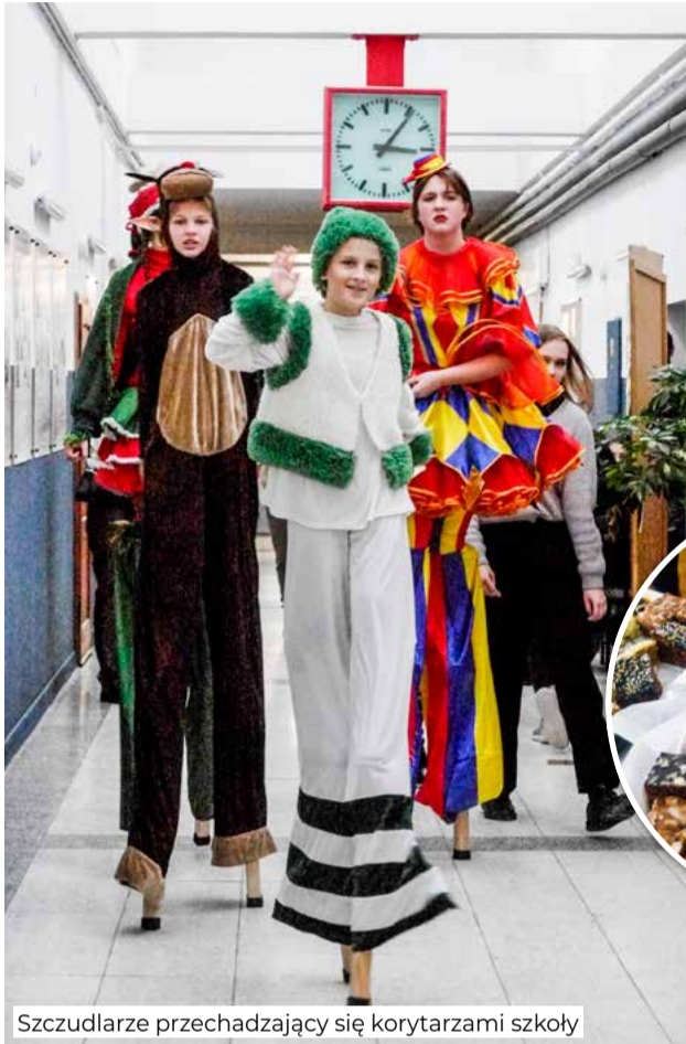
Szczudlarze przechadzający się korytarzami szkoły