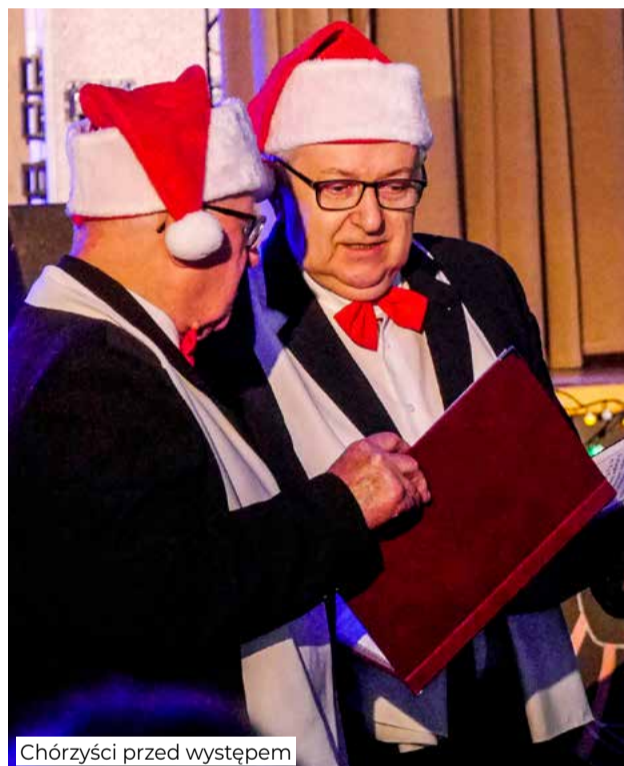
Chórzyści przed występem