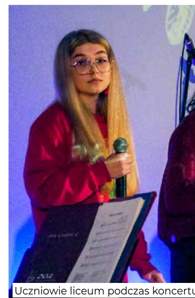
Uczniowie liceum podczas koncertu