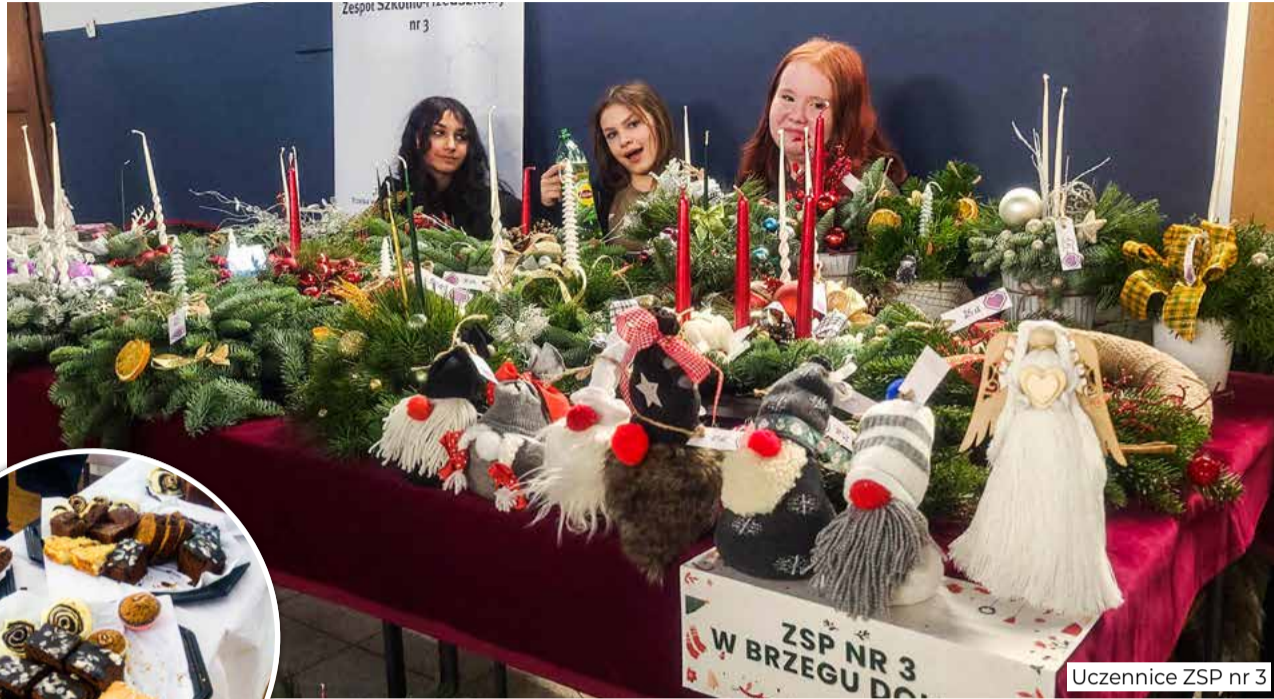
Uczennice ZSP nr 3