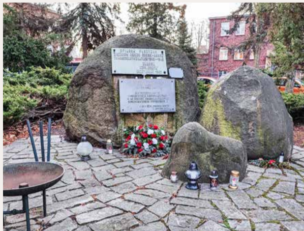
Pomnik ofiar filii obozu Gross-Rosen przy ul. Sienkiewicza w Brzegu Dolnym

Ewakuację zarządził z powodu zbliżania się Armii Czerwonej, która wyzwalała Dolny Śląsk. Oba obozy koncentracyjne powstały w 1943 roku na potrzeby niemieckiego przemysłu zbrojeniowego. W Brzegu Dolnym (dawniej zwanym Dyhernfurth) zbudowano fabrykę gazów bojowych „Anorgana”. Obozy zlokalizowano w rejonie dzisiejszej ulicy Sienkiewicza. W Obozie Dyhernfurth I, znajdującym się na terenie fabryki, więźniowie napełniali pociski artyleryjskie i bomby gazami tabun i sarin. Liczba więźniów nie przekraczała 300 osób. Więźniów pilnowało 20 SS-manów. Z kolei więźniowie obozu Dyhernfurth II byli wyko-