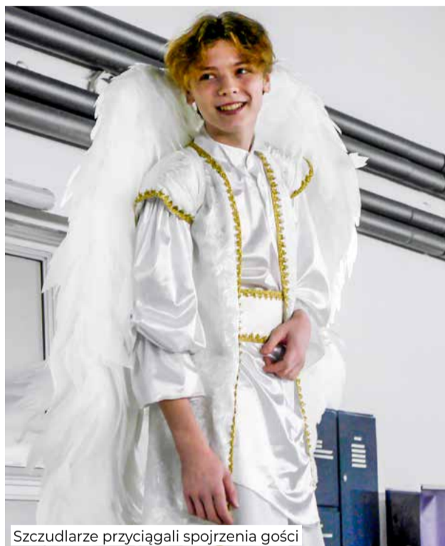
Szczudlarze przyciągali spojrzenia gości