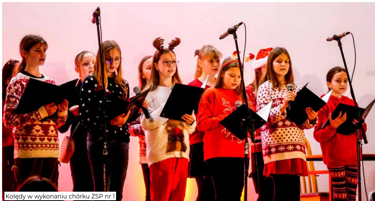
Kolędy w wykonaniu chóru ZSP nr 1

W niedzielę, 18 grudnia uczniowie Liceum Ogólnokształcącego im. J.M. Ossolińskiego w Brzegu Dolnym wprowadzili wszystkich w świąteczny, pełen magii nastrój podczas VIII Festiwalu Bożonarodzeniowego.