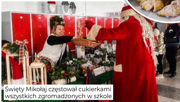
Święty Mikołaj częstował cukierkami wszystkich zgromadzonych w szkole