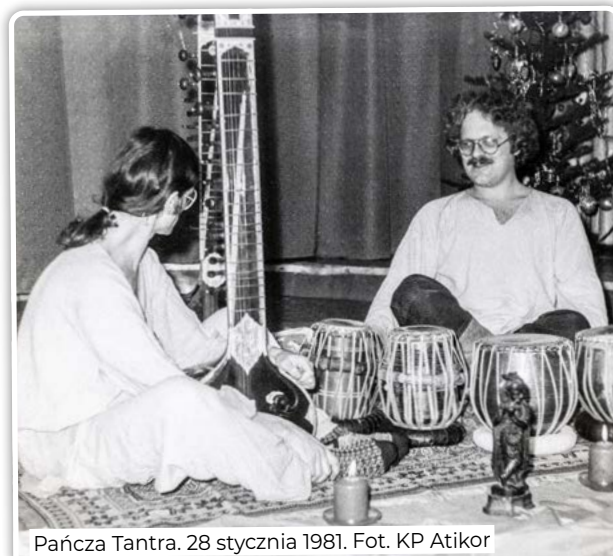
Pañca Tantra. 28 stycznia 1981.