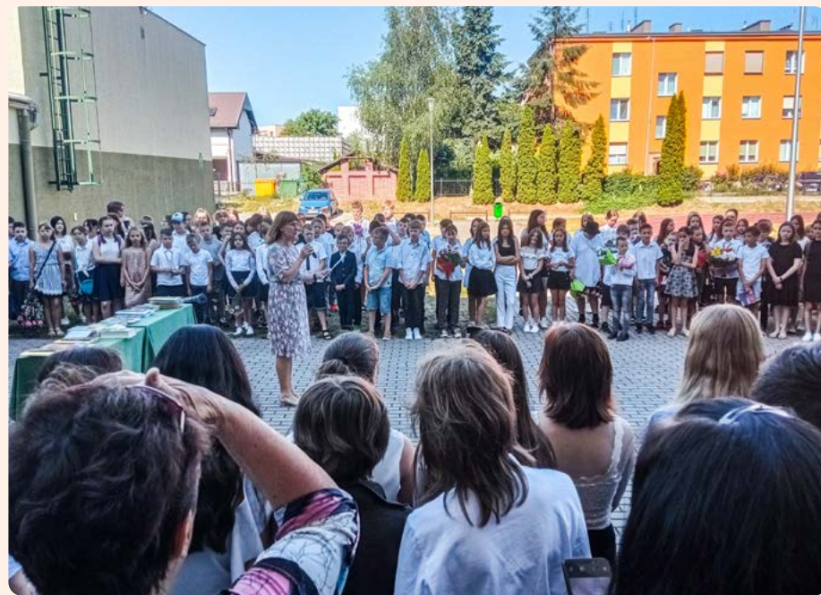
Zespół Szkolno-Przedszkolny nr 1, ul. Młodzieżowa