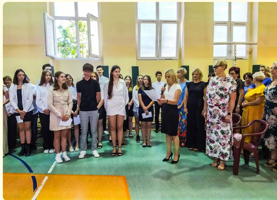
Zespół Szkolno-Przedszkolny nr 3