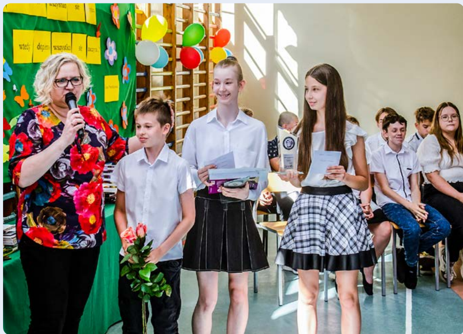
Zespół Szkolno-Przedszkolny nr 2