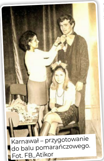
Karnawał – przygotowanie do balu pomarańczowego.