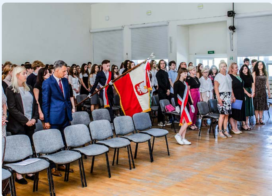
Liceum Ogólnokształcące im. J. M. Ossolińskiego