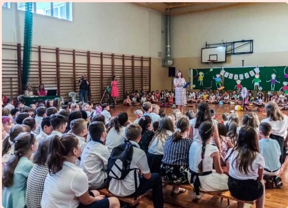
Zespół Szkolno-Przedszkolny nr 1, ul. Wilcza