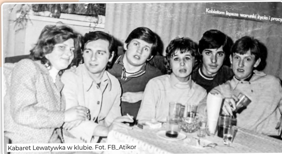
Kabaret Lewatywka w klubie.

Wspólnie z biblioteką miejską organizowano imprezy literackie, jak spektakl słowno muzyczny „Szklany ptak” na podstawie poezji Krzysztofa Kamila Baczyńskiego oraz turniej czytelniczy obejmujący znajomość literatury polskiej okresu powojennego pt. „Ojczyzna – naród – społeczeństwo”.