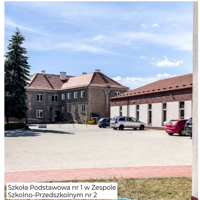
Szkoła Podstawowa nr 1 w Zespole Szkolno-Przedszkolnym nr 2

wała ograniczeniem zapotrzebowania obiektów na energię cieplną i elektryczną oraz obniżeniem kosztów energii, ponoszonych przez szkoły.