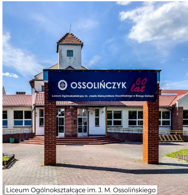
Liceum Ogólnokształcące im. J. M. Ossolińskiego

Wdrożenie projektu ma na celu ograniczenie strat ciepła w budynkach placówek oświatowych za sprawą poprawy ich efektywności energetycznej, a także zmniejszenie poziomu emitowanych przez nie szkodliwych substancji. Realizacja zadania będzie skutko-