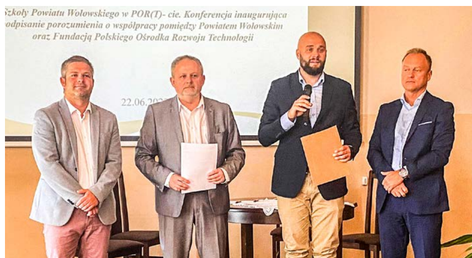
Szkoły Powiatu Wołowskiego w POR(T)-cie. Konferencja inauguracyjna odpisanie porozumienia o współpracy pomiędzy Powiatem Wołowskim oraz Fundacją Polskiego Ośrodka Rozwoju Technologii