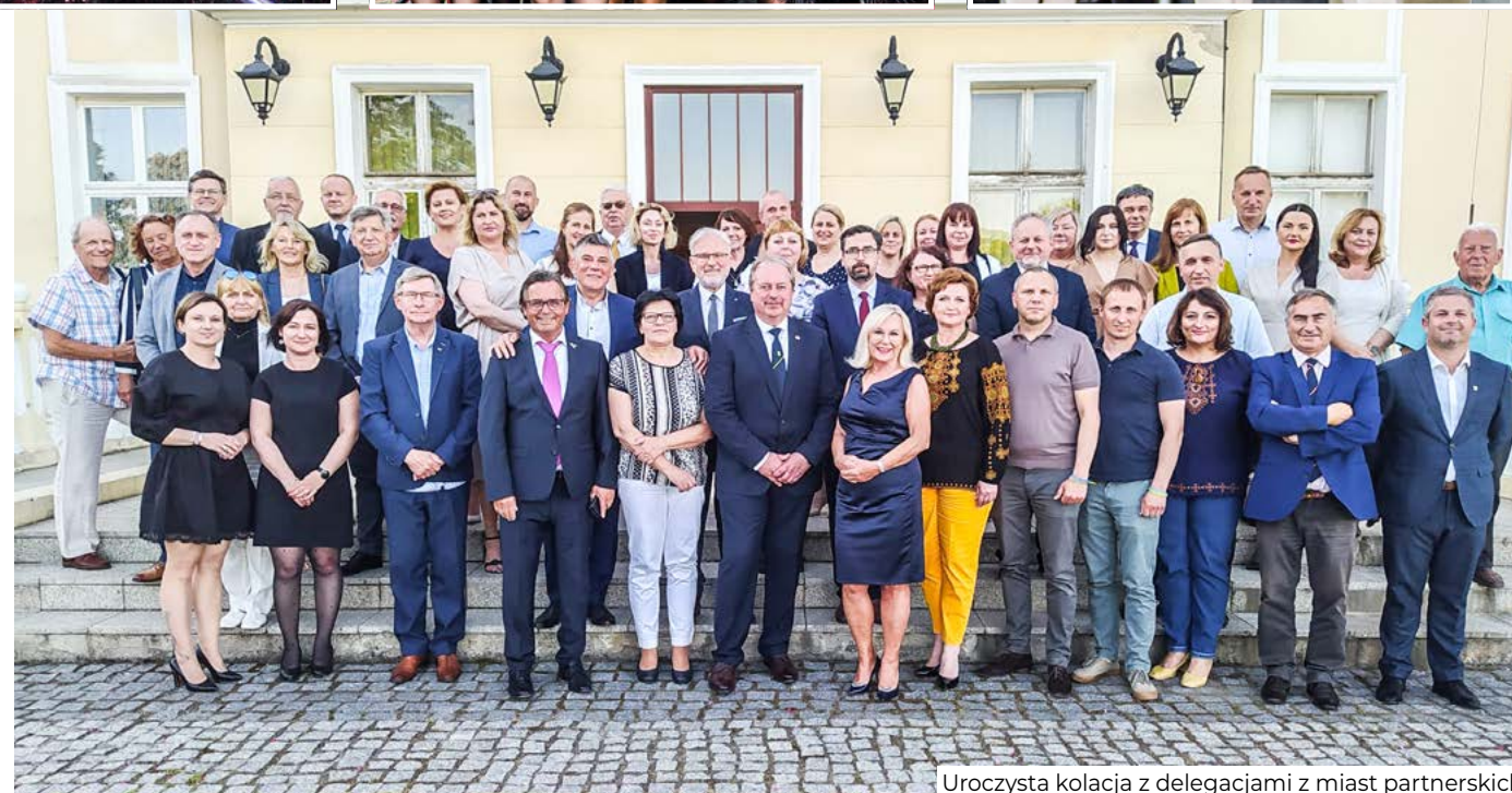
Uroczysta kolacja z delegacjami z miast partnerskich