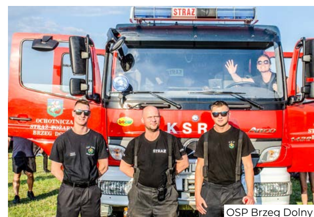
OSP Brzeg Dolny