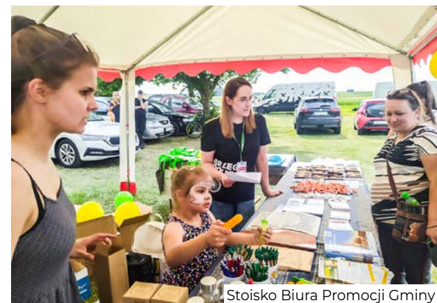
Stoisko Biura Promocji Gminy