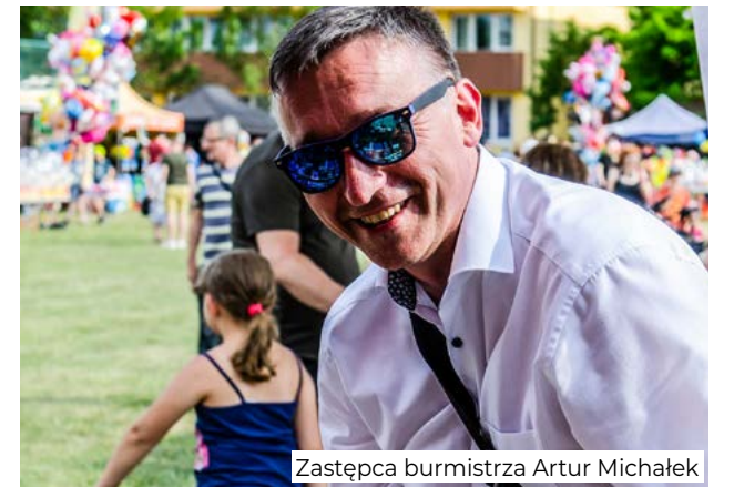
Dzieci chętnie korzystały z darmowego wesołego miasteczka