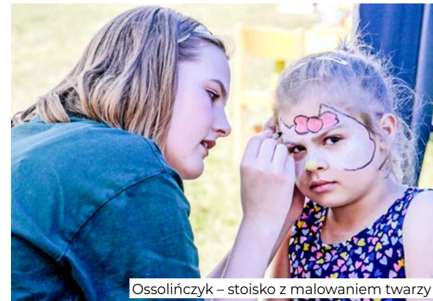
Ossolińczyk – stoisko z malowaniem twarzy

Na terenie przy Miejskim Ośrodku Sportu i Rekreacji rozbrzmiewała muzyka, a wraz z nią można było usłyszeć śmiechy i wesołe okrzyki dobiegające nas z darmowego wesołego miasteczka. Kilka kroków dalej, na scenie do wspaniałej zabawy zgromadzonych przygotował zespół Marvikał. Następnym w kolejce był występ sekcji młodzieżowej działającej w Dolnobrzezkim Ośrodku Kultury prezentującej ciekawe aranżacje znanych i lubianych utworów. Zespół Mikrut (Microot) & Wroblevsky przedstawił przed publicznością gitarowe brzmienia w stylu reggae – tak wprowadzeni w klimat gorąco przyjęliśmy zespół Bethel. Na koncercie obecni byli wierni fani spoza Brzegu Dolnego, którzy przyjechali świętować razem z nami – połączeni dobrą energią bawiliśmy się wspólnie aż do ostatniego z bisów. Na koniec mieszkańcy mogli wytańczyć się na dyskotekce do hitów przygotowanych przez Dj'a Zarzyka.