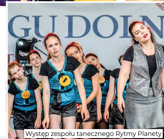
Występ zespołu tanecznego Rytmu Planety