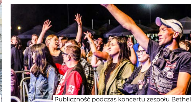
Publiczność podczas koncertu zespołu Bethel