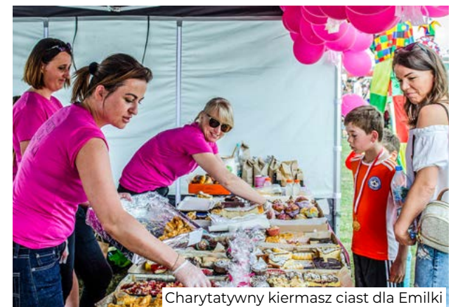
Grupa Ratownictwa Specjalistycznego „Cichociemni”