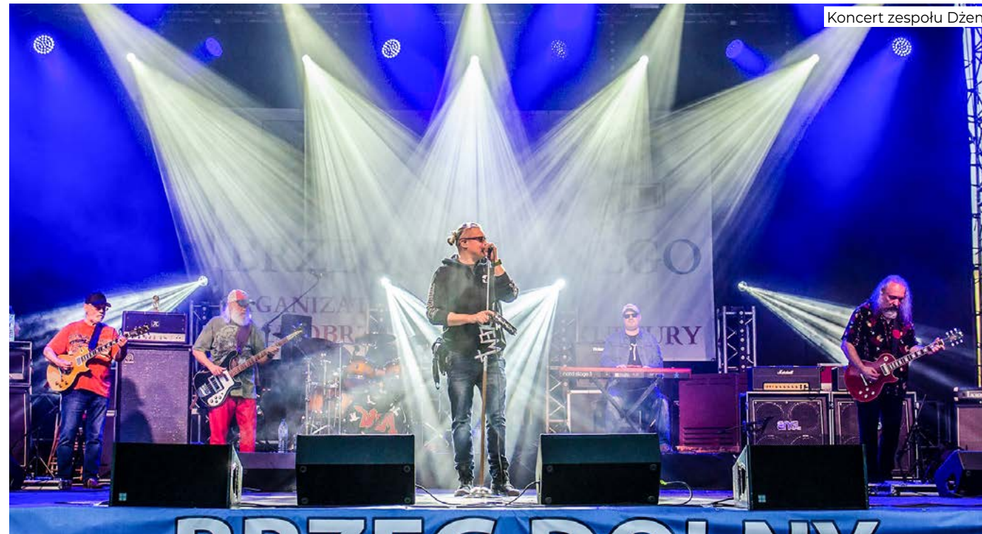
Koncert zespołu Dżem