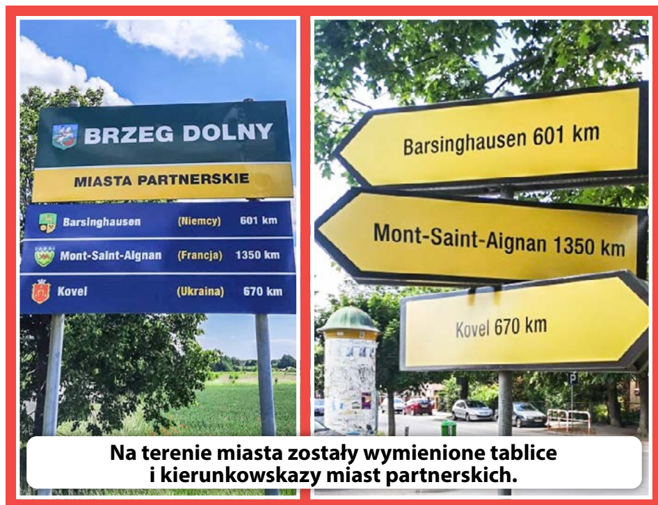
Na terenie miasta zostały wymienione tablice i kierunkowskazy miast partnerskich.

Na podstawie art. 35 ust. 1 i 2 ustawy z dnia 21 sierpnia 1997 r. o gospodarce nieruchomościami (Dz.U.2020.1990 ze zmianami) podaje się wykaz nieruchomości przeznaczonych do najmu w drodze przetargu ustnego nieograniczonego: