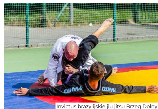
Invictus brazylijskie jiu jitsu Brzeg Dolny