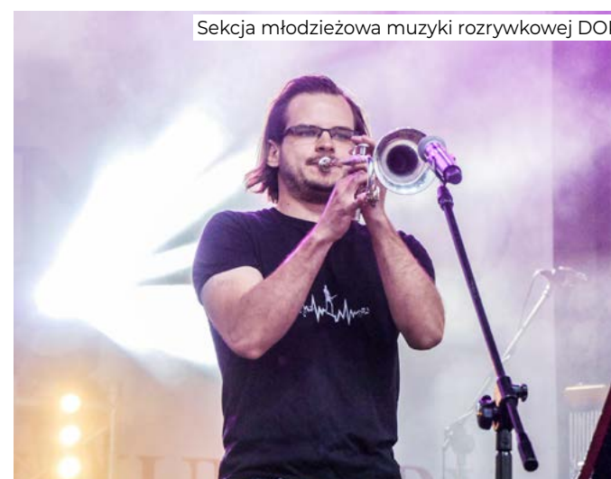
Sekcja młodzieżowa muzyki rozrywkowej DOK