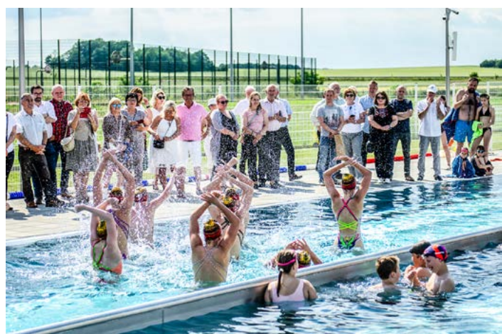
Uroczyste otwarcie basenów