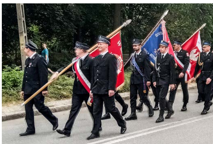
Powiatowy Dzień Strażaka