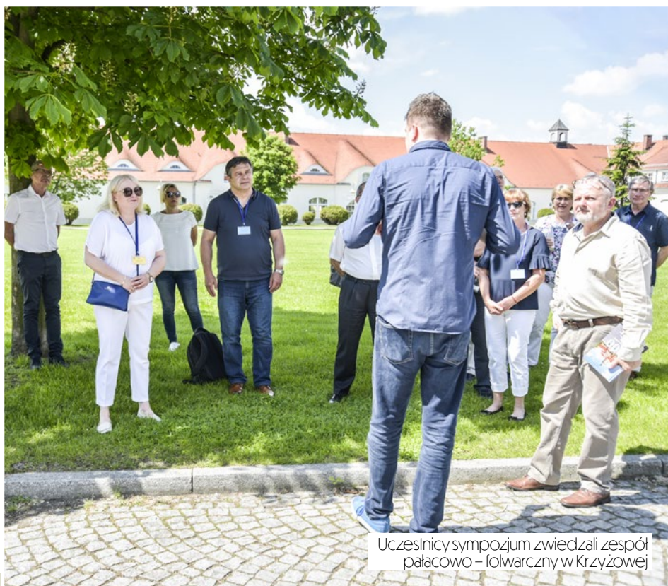
Uczestnicy sympozjum zwiedzali zespół pałacowo-folwarczny w Krzyżowej