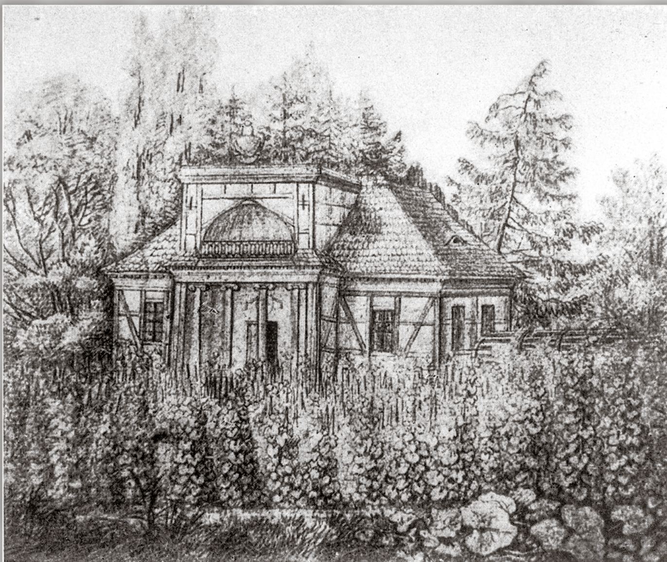
Dom w winnicy w dolnobrzeskim parku wg projektu C.G. Langhansa. Usytuowany na sztucznie usypanym pagórku (pozostałością jest ruina piwnicy położona nieopodal boisk treningowych stadionu miejskiego).